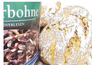
Ein herzhaftes Käferbohnenweckerl.