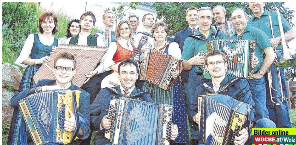
Anlässlich des Semesterabschlusses des Stoanineums wurde zünftig aufgespielt. WZ

Aus diesem Grund ließen es sich die Stoakogler nicht nehmen und lauschten begeistert den neuen Musikerinnen und Musikern und gaben selbst einige Stücke von der neuen CD zum Besten.